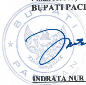
INDRATA NUR BAYUAJI

Pacitan, 23 September 2025 Pihak Pertama, Pt. CAMAT BANDAR